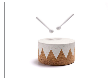
© PEDRITA, Rufo