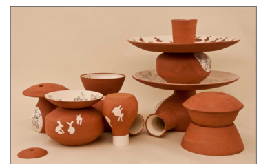
© PEDRITA, Coelhos Alentejanos, Photo: Maunel Chichorro