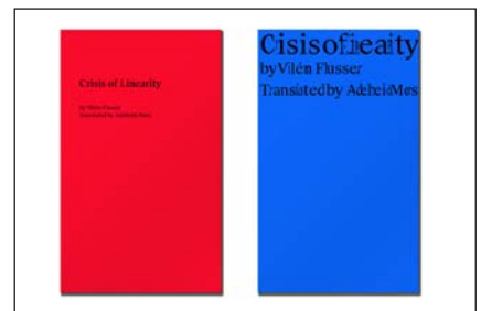
Postdigital ist besser* © Content-Aware Scaling / Robert Preusse