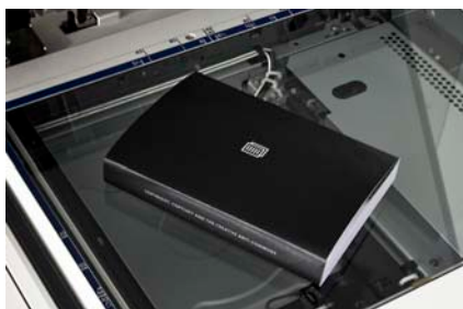
Postdigital ist besser*