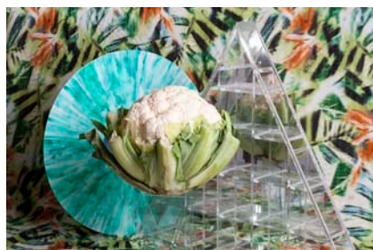
Postdigital ist besser* © Ain't no content / Nora Heinisch und Idan Sher

Ausstellungen Veranstaltungen Kooperationen