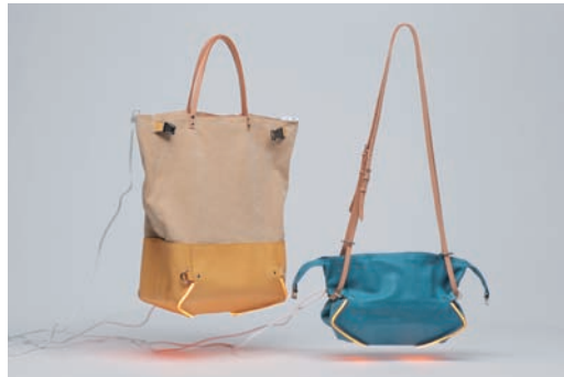
© Solveig Gubser, Fotograf: Andreas Schimansky und Jennifer Rippel