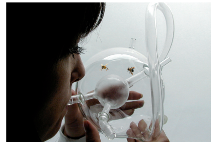
© Susana Soares_ "BEE'S" _Precise object