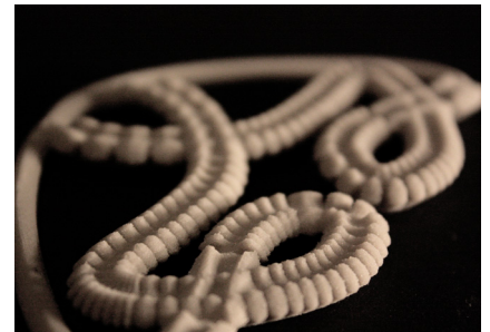
© Susana Soares_ Insects au gratin