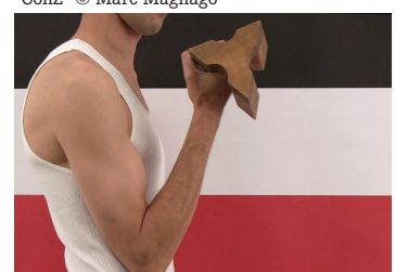
“Cultural Weight” © Yair Kira