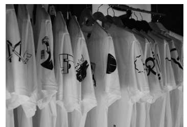
"A Fanshop"

designtransfer is the gallery and communication platform for the College of Architecture, Media and Design at Berlin University of the Arts (UdK Berlin). As a communicative interface between the university and the public, designtransfer organises exhibitions, hosts events on design issues, and acts as a cooperative partner for external projects and competitions.