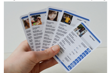
“pro file” © Marie Scheurer