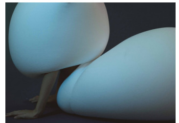
"Zwischen Körper und Raum"

The increased physical and digital mobility of the information society has led to the isolation of individuals, despite the fact that many of us are able to hold multiple memberships in countless communities. This gave rise to an interesting paradox - a surge of networking has accelerated the rate at which individuals are disconnected from long-lasting, stable and traditional social structures.