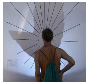
"Greenwich Globe"