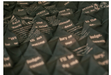
"Conceptual Interface" © Alisa Goikhman

The challenge for a cultural commuter lies in taking the experiences from one context in one world, and finding a way to communicate, integrate and mediate them in a different one. This act can lead to problems and conflicts, but at the same time carries a great creative potential. New flexible models are required in order to generate communities which are undeterred by physical distances as well as political, religious, social and cultural differences.